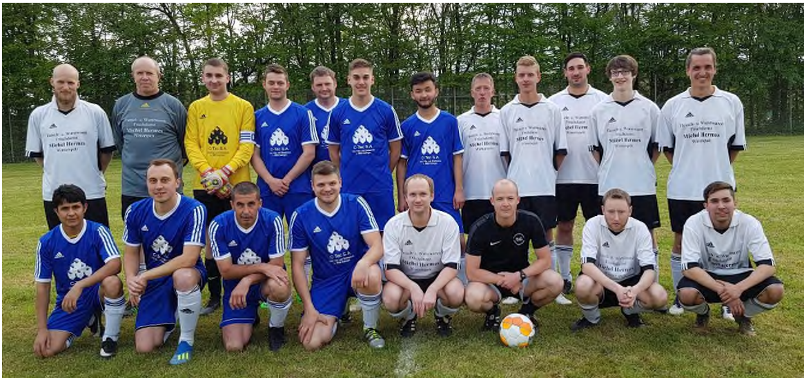
Die Spieler der gegnerischen Seiten, wobei dann die linke Seite mit 4:2 über die rechte Seite siegte