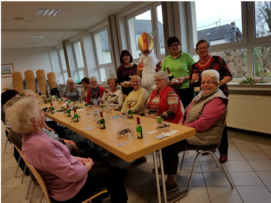
auch in diesem Jahr besuchte der Nikolaus die Senioren bei ihrem monatlichen Treffen