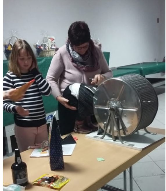
fast wäre die Glücksfee in die Trommel gefallen ...