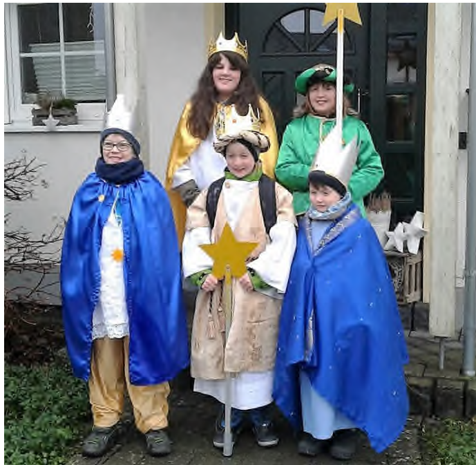
im Januar zogen die Sternsinger durchs Dorf