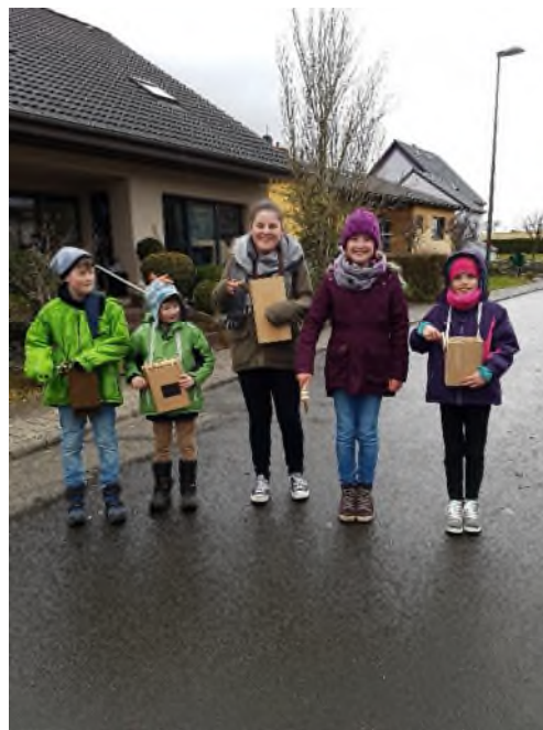
und an Ostern die Klapperkinder