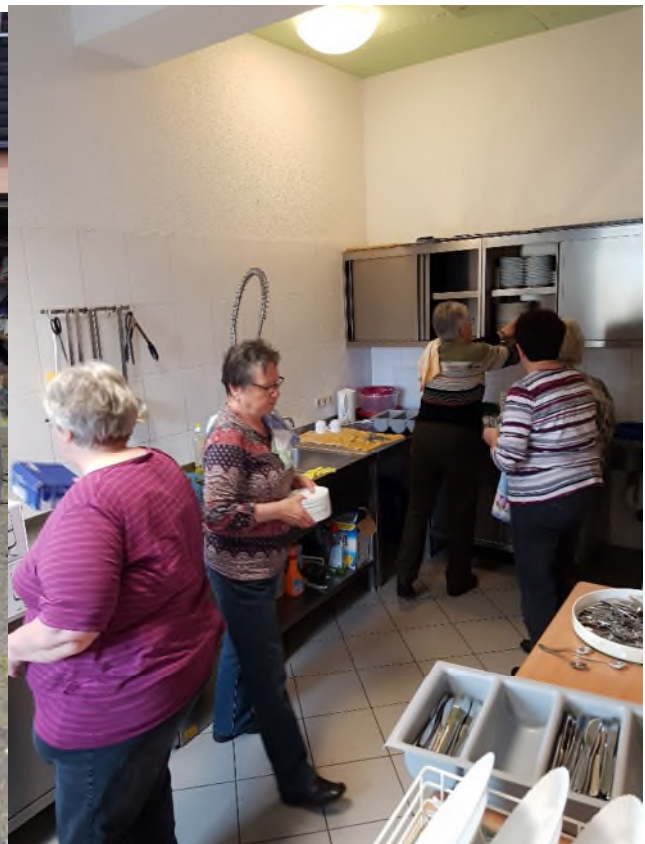
und im Dorfgemeinschaftshaus