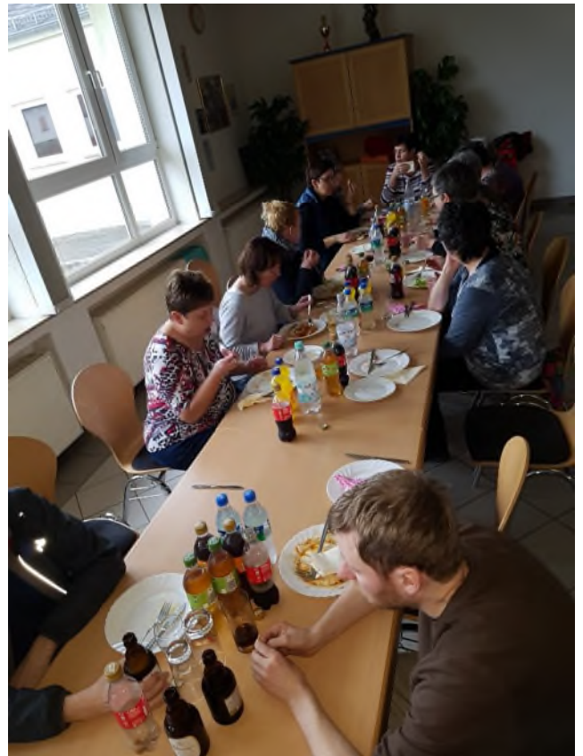
beim gemeinsamen Mittagessen