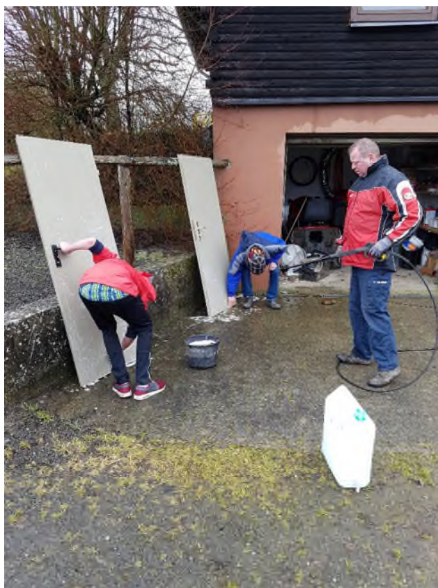
Reinigungsarbeiten an der Grillhütte

Die Ortsgemeinde Dahnen bedankte sich im Anschluss an die Aktion mit einem gemeinsamen Mittagessen bei den ca. 40 teilnehmenden Aktiven.