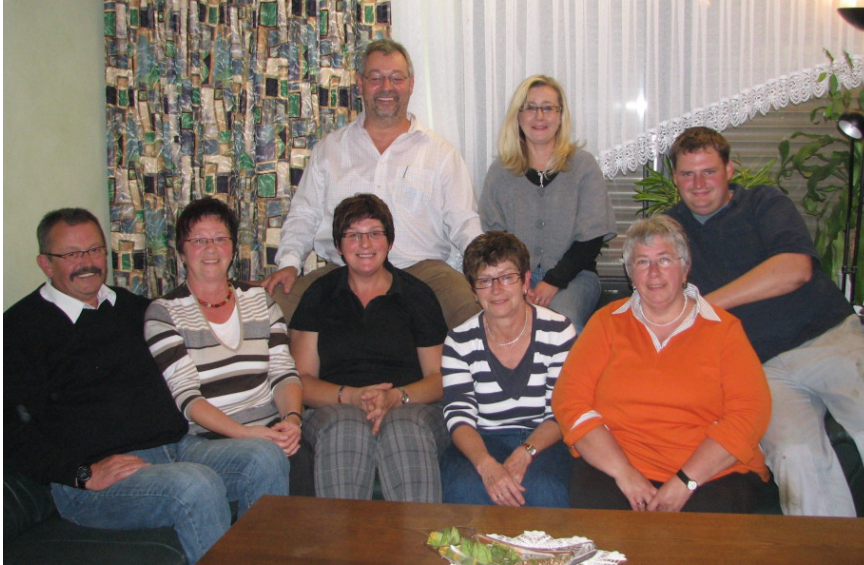
Die Theatergruppe „ungeschminkt“