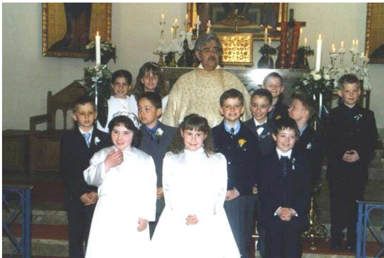
die Kommunionkinder der Pfarrei Daleiden