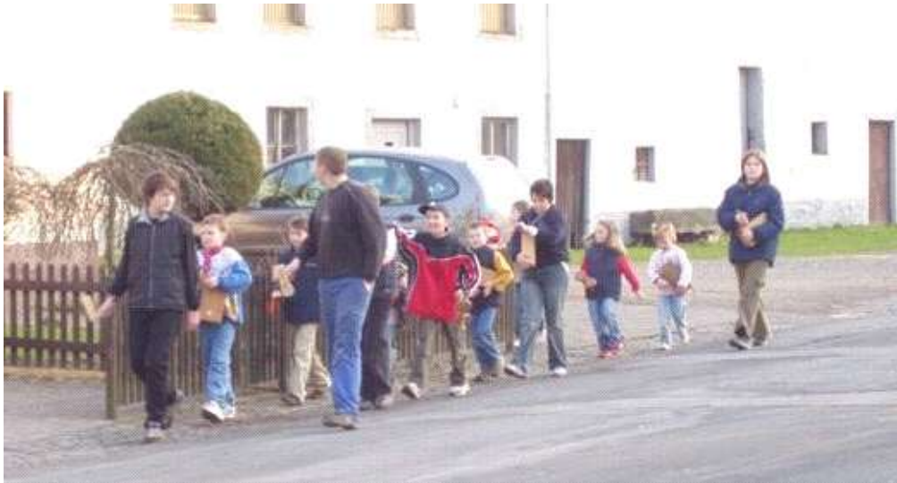
Die Klapperjungen und -mädchen aus dem Unterdorf