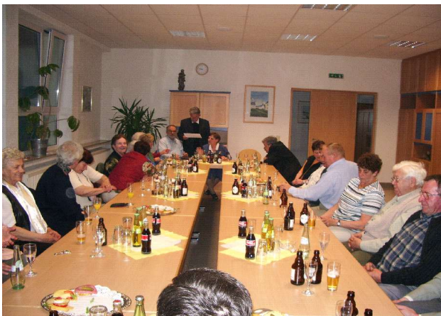
während des Empfangs der ehem. KZ-Häftlinge