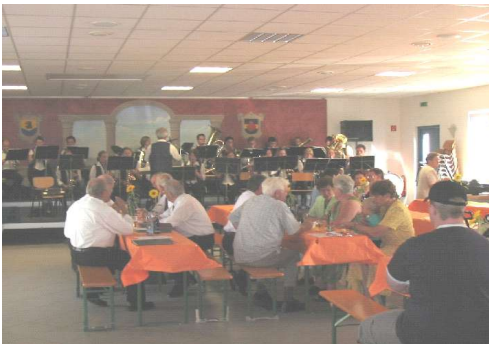
während des Konzertes des Musikvereins Lützkampen