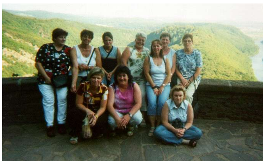
Gruppenbild vor der Saarschleife

bildete der Besuch des Weinfestes in Saarburg. Bei lauer Abendluft wurde der gute Saarwein genossen. Gegen Mitternacht traten die Möhnen gut gelaunt die Heimreise an. Es war ein richtig schöner blauer Montag.