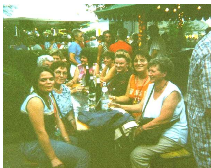
auf dem Weinfest in Saarburg