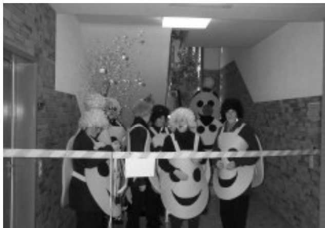
bei der Erstürmung der Bürgermeisterei 2003