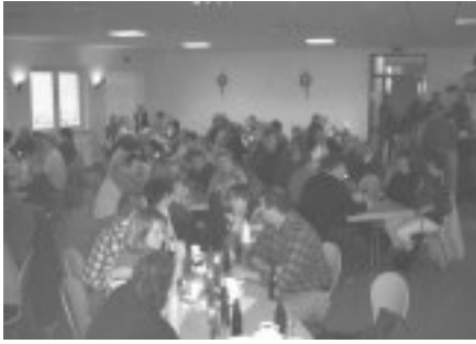
während des Adventsnachmittags