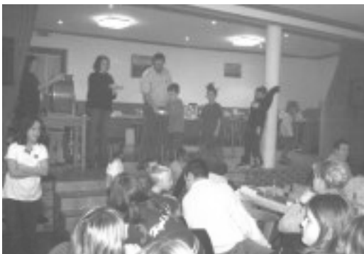
während der Martinsverlosung

Nach einer Abstimmung der Kinder zwischen der Kinderfreizeit in Fischbach-Oberraden oder einer Tagestour ins Phantasieland nach Köln, hatte sich die Mehrheit der Kinder für die Tour nach Fischbach-Oberraden ausgesprochen. Hier sei noch angemerkt, dass letztes Jahr 24 Kinder nebst Betreuern an dem Ausflug nach Fischbach-Oberraden teilnahmen. Die Kosten hierfür betragen 1 136,14 €.